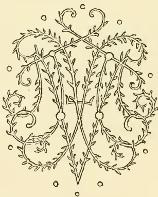
Chiffre de Marie-Josèphe, sur une reliure de Le Monnier.